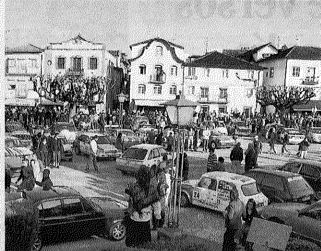
Un año más, la pericia automovilística y la lamprea se citan en Monção este fin de semana.

y España, el Rally vuelve a englobar por segundo año una prueba nocturna. Será mañana a partir de las 20.30 (hora lusa) y se espera repetir el éxito de la anterior edición. El domingo se realizan pruebas a partir de las 11.00 horas y, por la tarde, desde las 16.00.