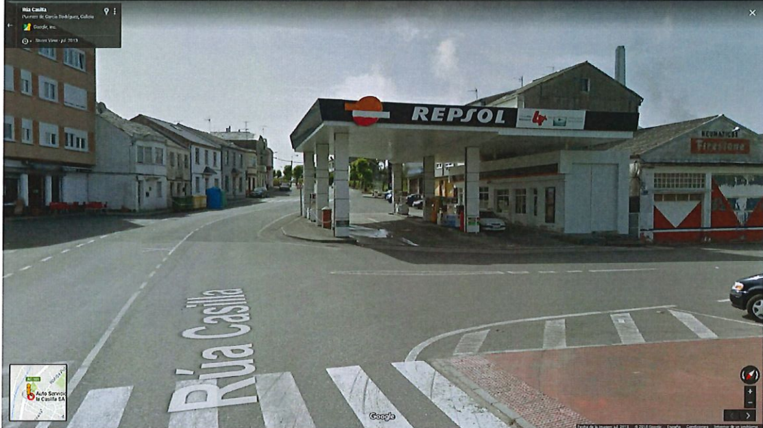
Gasolinera designada Repsol, Autoservicio la Casilla. Pontes de García Rodríguez (As). 981 45 03 11