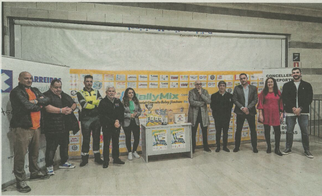
Imagen de la presentación oficial de la octava edición del Rallymix de Barbadás. ALEJANDRO CAMBA

Motor La competición deportiva, que cumple su octava edición, introduce novedades en el recorrido y en el parque cerrado