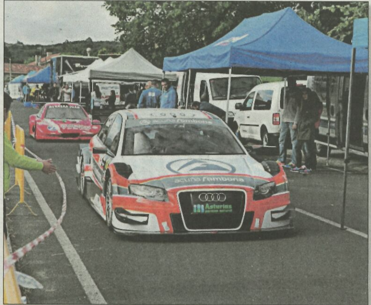
Vehículos participantes en la última edición, la del año 2015.

Pronto será historia la edición de 2022. Empezará entonces la cuenta atrás para la de 2023. O no. "Sabe Dios, ahora mismo digo que no la voy a hacer. Ésta ha sido posible más por la petición de los pilotos que por otra cosa. Todo va a depender de lo que apriete la gente a la que le gusta este mundo del motor", remacha.