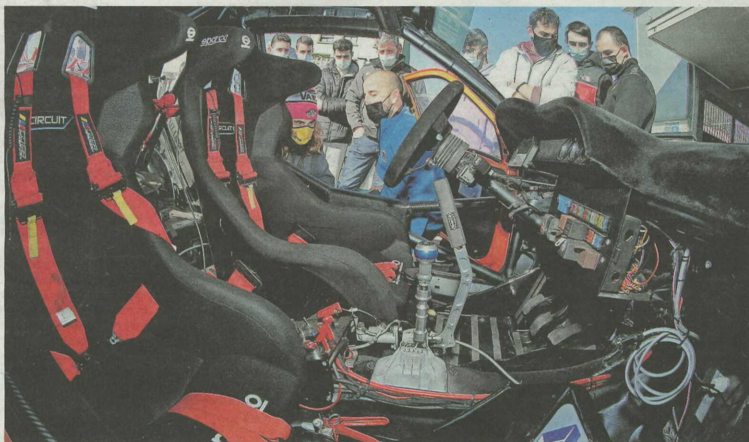
Alumnos del CIFP Coroso participaron en una formación de la federación gallega para hacer las verificaciones técnicas.

También implantará cribados cada quince días entre el personal sanitario que no esté vacunado.