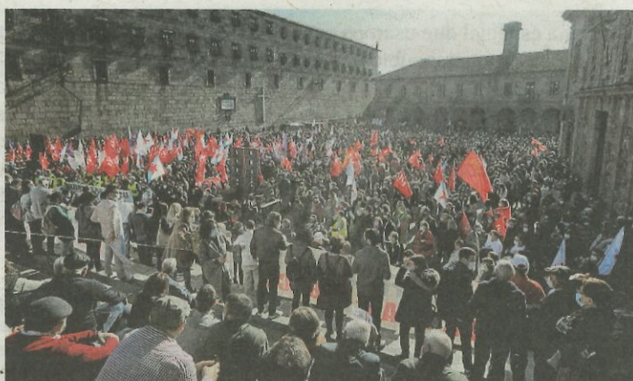
Miles de personas se manifestaron en Santiago.