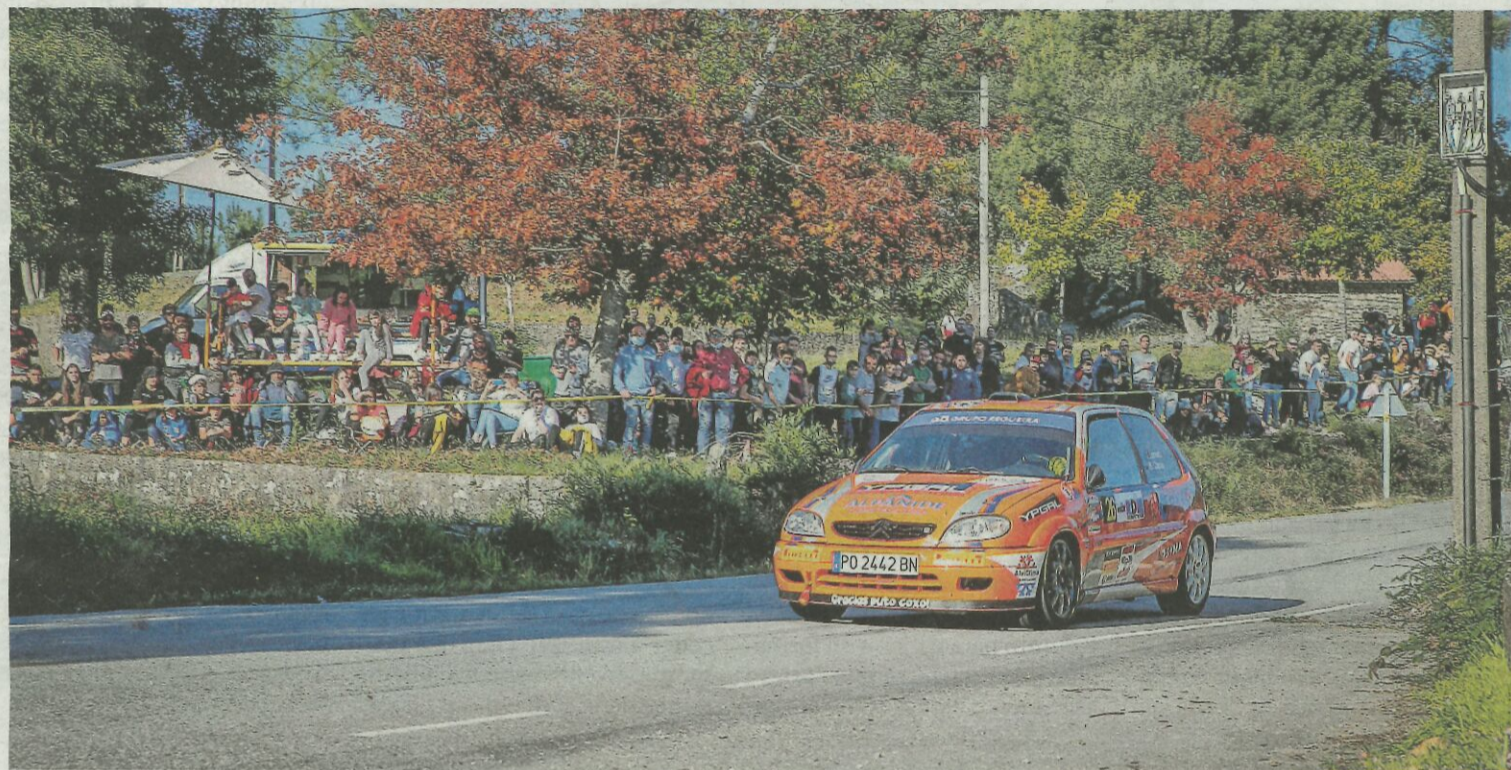
Centenares de personas se dieron cita en la competición automovilística, como ocurrió en el tramo que se celebró en Rianxo.