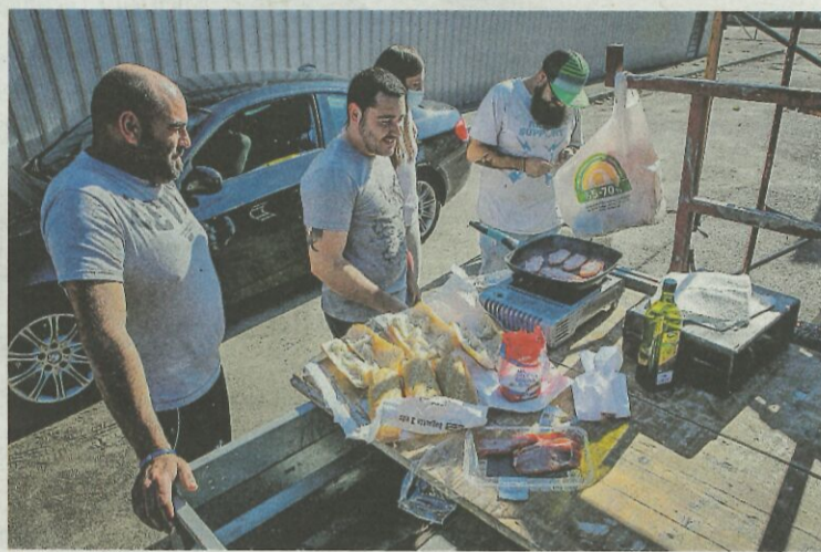
Varios forofos no dudaron en llevarse la cocina portátil para el almuerzo.

Desde la escudería organizadora desearon que la jornada sea tan buena como la de ayer y afirmaron que tratarán conseguir que los tres primeros clasificados acudan a las puertas del ayuntamiento para que los aficionados puedan fotografiarse con ellos.