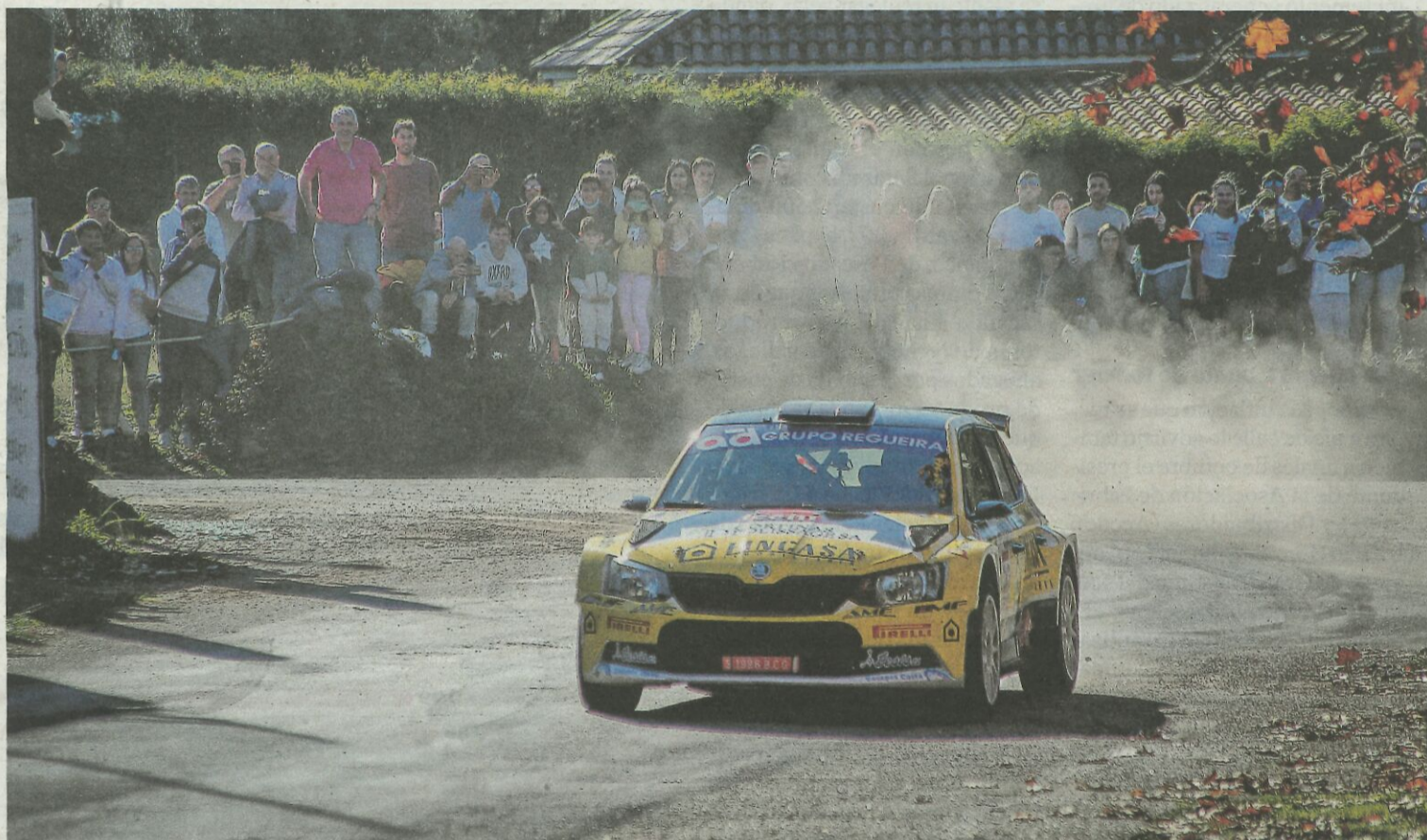
El piloto de Gondomar, en el momento de pasar por el campo de A Trinidad, en Oleiros, en el último tramo de la jornada de ayer.

Realizan trabajos en las mámoas de Os Campiños para garantizar su conservación 12