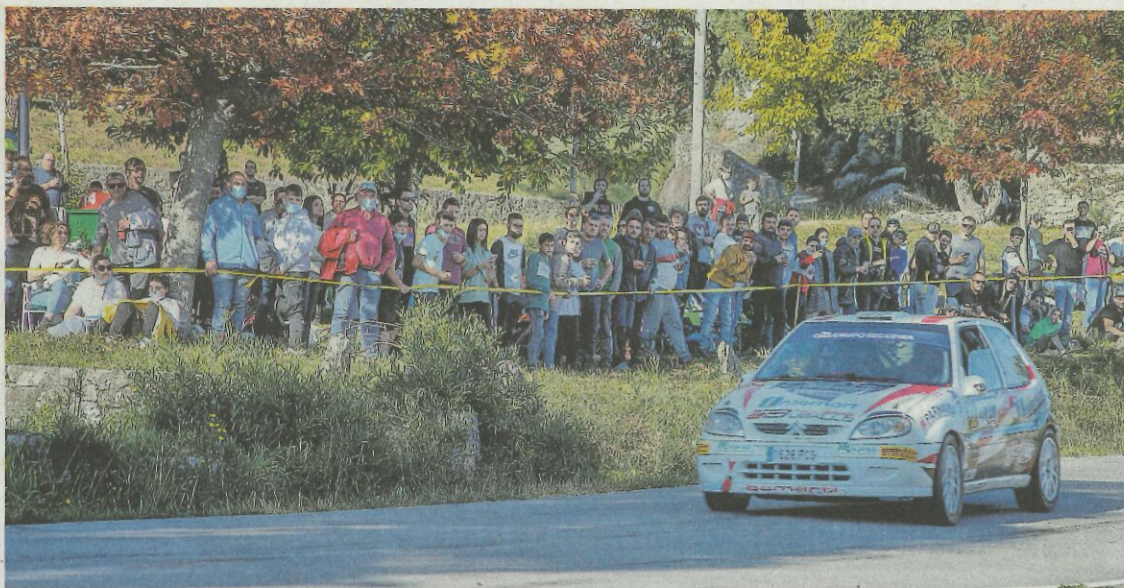
Centenares de personas se dieron cita en la aldea de Ourille, en Rianxo, para seguir el rali.

Lo cierto es que centenares de personas se repartieron por las mejores curvas de las dos primeras mangas, la rianxeira Mancomunidade do Barbanza y la boirense Furgonet Barbanza. Ambas cumplieron las exigencias de los espectadores, sobre todo en la segunda pasada, donde los pilotos fueron agasajados con aplausos, vítores y gritos de apoyo.