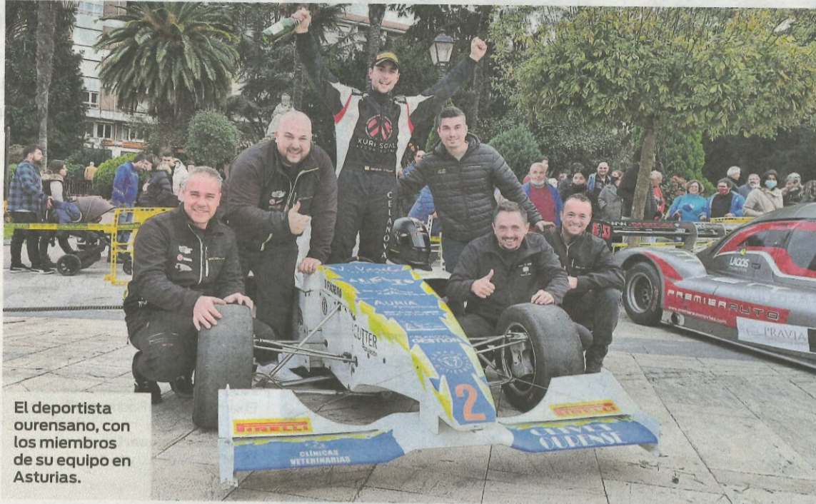
El deportista ourensano, con los miembros de su equipo en Asturias.

Tras la primera prueba del Gallego, reflexión y momento para un cambio inesperado. "Apareció un comprador para nuestro fórmula Outeda y lo vendimos. Claro, nos vimos sin coche para terminar la temporada y queríamos competir