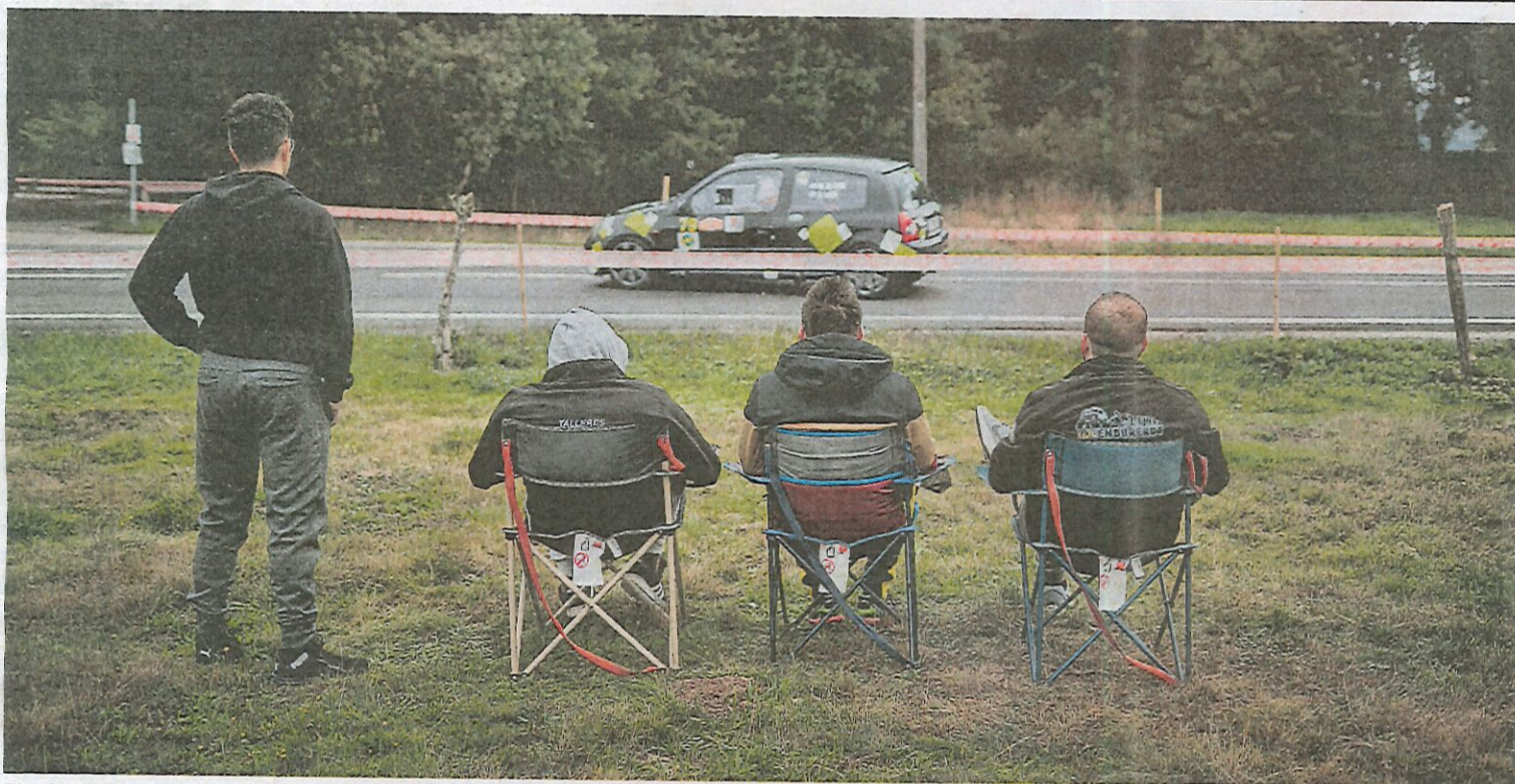
El público agudizó el ingenio para cumplir protocolos y disfrutar de una carrera que coronó a Víctor Senra.

La transmisión del virus en Galicia, en niveles de «nueva normalidad»