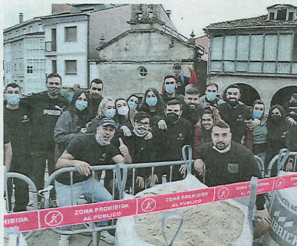
La alegría, que no falte.