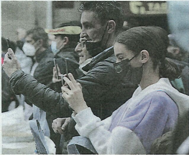
Los recuerdos, imprescindibles