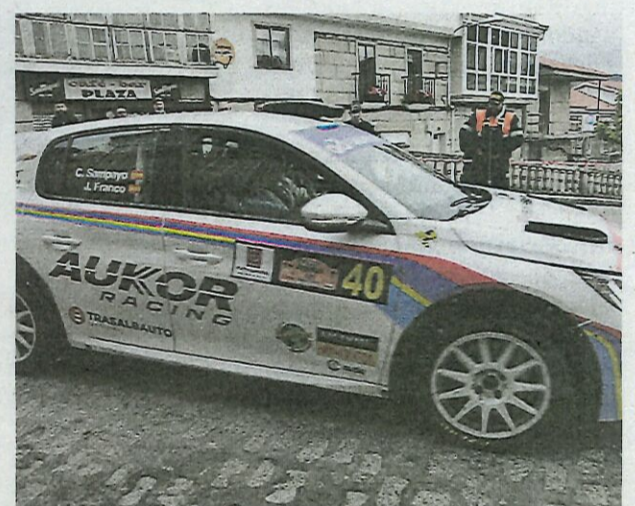
Buen debut de Sampayo y Franco con el 208.