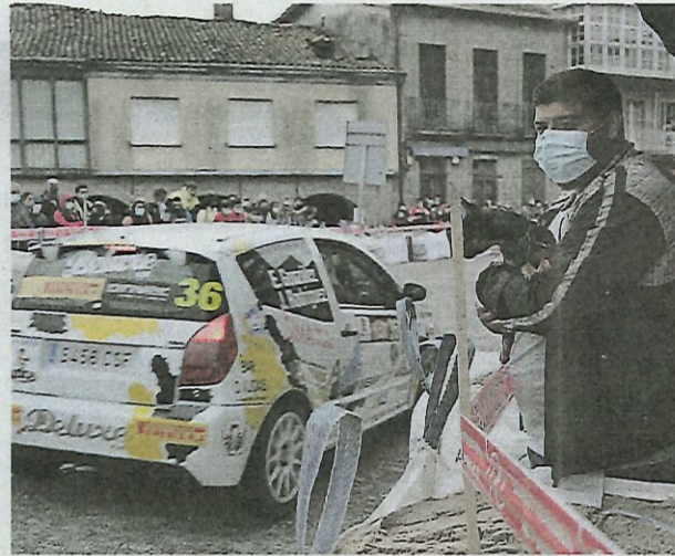
Un aficionado, bien acompañado en Maceda.