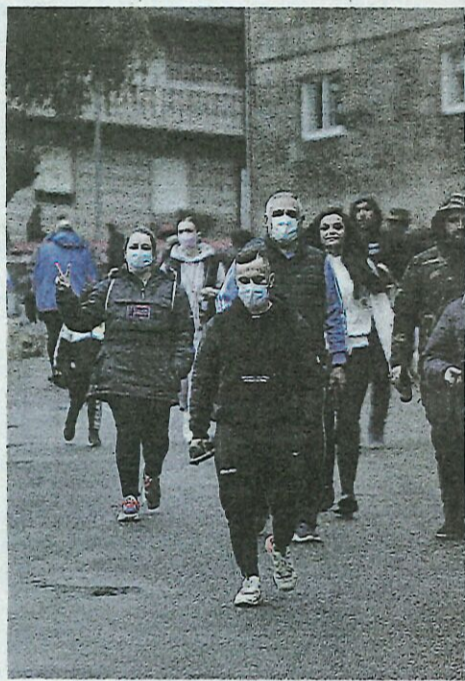
Todos a la meta de Luintra.