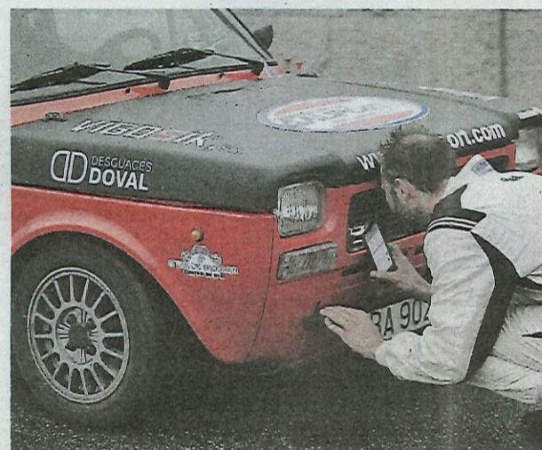
Hay que revisar que todo esté correcto.