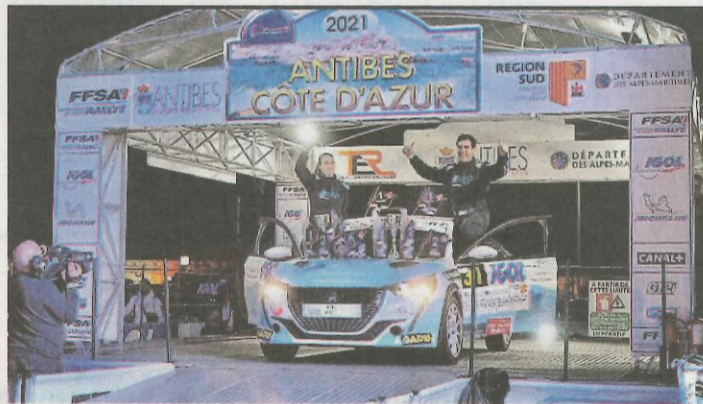
Los pilotos de Ferrolterra, en el podio de la prueba francesa.