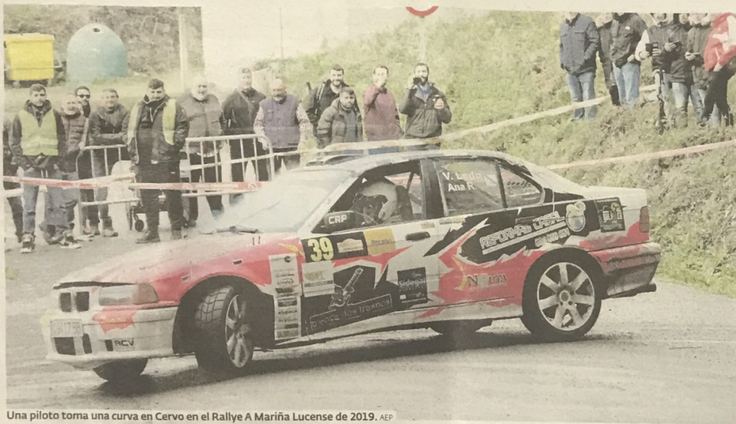
Una piloto toma una curva en Cervo en el Rallye A Mariña Lucense de 2019.