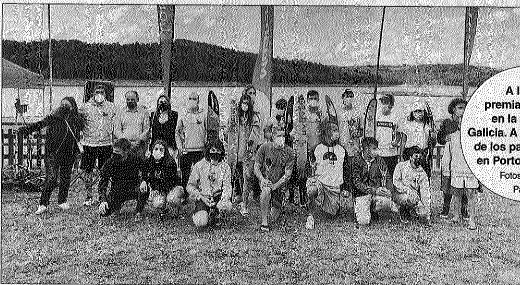
A la izq., premiados, ayer, en la Copa de Galicia. A la dcha., uno de los participantes, en Portodemouros.