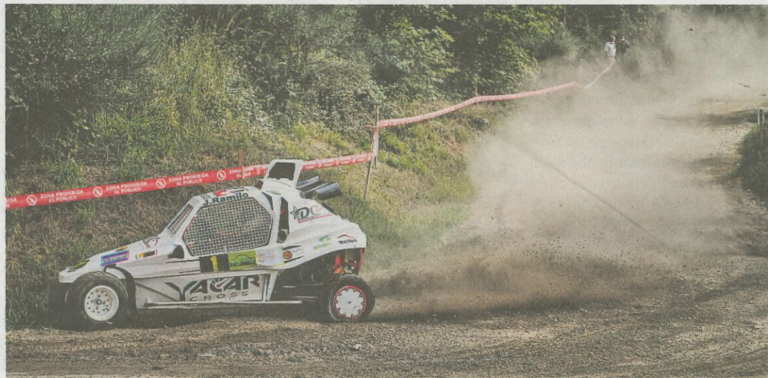
Los monoplazas Yacar coparon el podio, con Ramilo en el tercer cajón. AGOSTIÑO IGLESIAS

El tercer cajón del podio de Piñor fue para Javier Ramilo, completando así las tres primeras plazas los monoplazas Yacar. De nuevo, y como suele ser habitual en este tipo de pruebas que combinan asfalto y tierra, los rápidos KartCross lideraron la clasificación final, pero a pe-