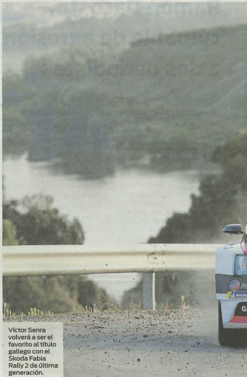
Víctor Senra volverá a ser el favorito al título gallego con el Skoda Fabia Rally 2 de última generación.