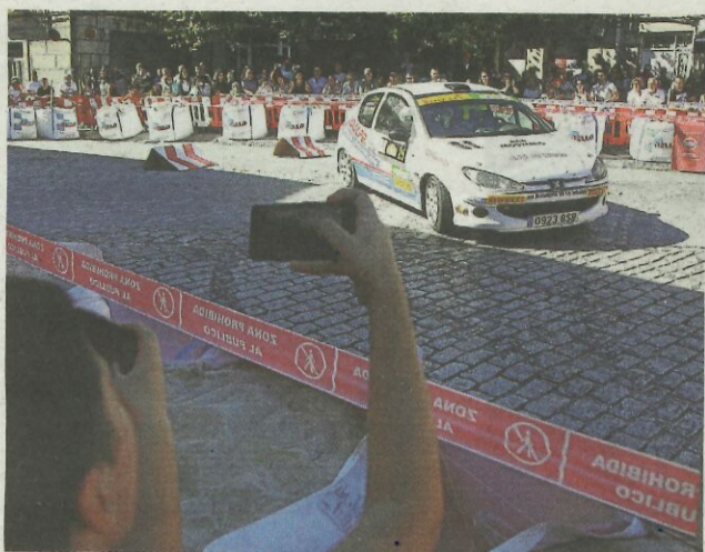
Los vehículos llevaron la acción al centro de Maceda.