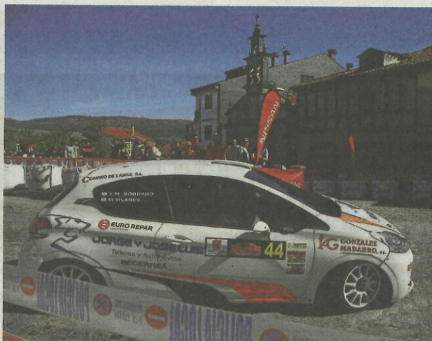
La dupla Sobrado-Vilares, a bordo de su coche.