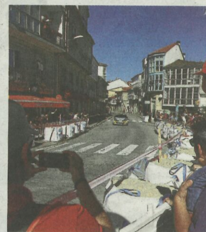
El día acompañó a los espectadores.

Cualquier lugar es bueno para seguir las evoluciones de los pilotos. Valen cunetas, aceras o, incluso, balcones con vistas privilegiadas como el que disfrutaron estos aficionados al motor en la jornada matinal de Maceda. La comodidad, siempre es un plus.