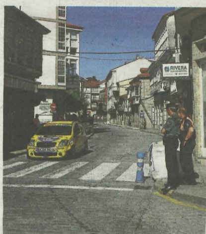
Guardia Civil y Emergencias, presentes.