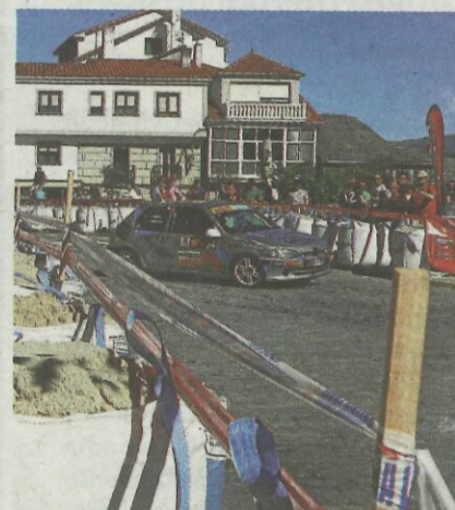
Difícil trazado con curvas cerradas.

CON EL SEGURO DE TU COCHE... NO TE LA JUEGUES