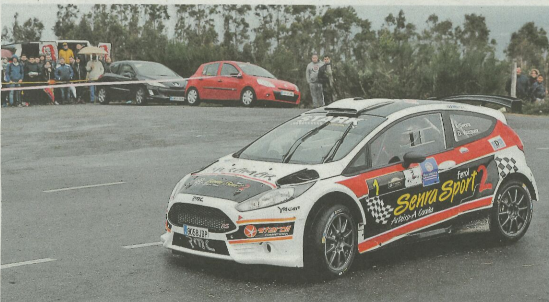
Senra intenta repetir el título que conquistó en la pasada edición del certamen gallego. CARMELA QUEJEIRO