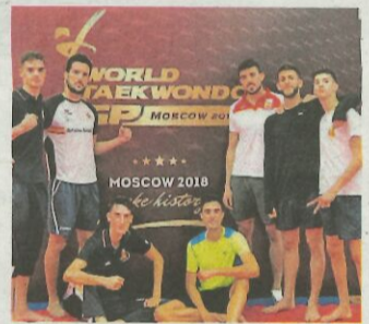
El equipo nacional masculino desplazado a Taoyuan.

El español Juanjo Lobato (Nippo Vini Fantini) ganó al esprint la Copa Sabatini disputada a través de 201 kilómetros con salida y llegada en la localidad italiana de Peccioli. El ciclista gaditano, de 29 años, se impulsó al esprint por delante de los italianos Sonny Colbrelli (Bahrain) y Gianni Moscon, con un tiempo en meta de 4h.41.37, a una media de 42,99 kilómetros hora. EFE