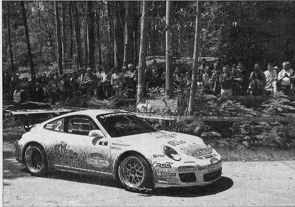
Imagen de una edición anterior del Rías Baixas.

A los miembros de la escudería les entusiasma especialmente la ilusión de los pilotos. Han sido dos años duros. El rallye desapareció por falta de financiación y sobre todo por el divorcio con el Concello de Vigo. Un comunicado certificaba su adiós en enero de 2016. En 2017 intentó resucitar de la mano de la Escudería Dona Urraca. Aquel acuerdo no prosperó y el Eurocidade (que aparecía como una de las pruebas de reserva del calendario de 2017 del Campeonato de España