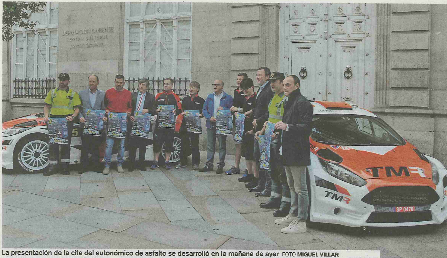
La presentación de la cita del autonómico de asfalto se desarrolló en la mañana de ayer