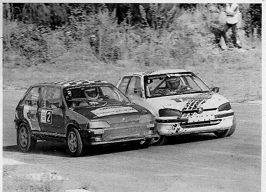
Los adelantamientos hicieron disfrutar a los aficionados.