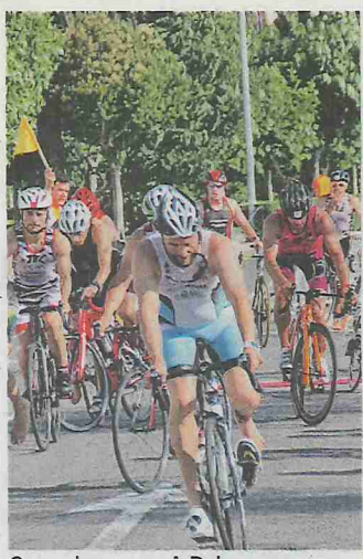
Corredores, en A Pobra. D. GESTOSO