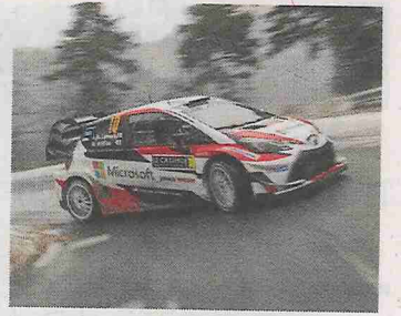
Latvala, en Montecarlo.

En cuanto a los participantes, los organizadores esperan poder superar el medio centenar de equipos inscriptos, buena parte de ellos de la zona.